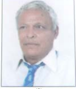
नाति महर्जन द्यःचपा, पांगा

नेवा:तेगु वस्ति जक लेया लेया इमिसं लं तवाला यायेत छें थुना चोंगु खँला छि बैक्या ऋण पुले हे मलावँ छेंथुना विया हर्त अत्याक जुया मनूत सिनाचोंगु खँ न्योला छि सहरे लं तवाला यायगु बहाना याना न्हूगु छेंत हे थुना हःगु स्यूला छि गामे गामे नं ज्यापुते बुँ दथुँ दथुँ तव्यागु लं देका हयाचोंगु खँला छि थुमिसं थथे लं दयकु दयकु छेंथुना भीत सहर पितना छोइतिनि न्ही गामेनं ज्यापुते हिरा सैगु बुँ अधिकरन यायाँ फोगिं याना पितना छोइतिनि न्हि ॥ आहे भीसं थुकेया विरोध मयात धा:सा भी नेवा:त नेपालं पलायन जुई मालीतिनी थःगु जन्मभूमि मेपिन्सं राजयागु स्वया नुग दाया खोया बने मालितीनी ॥ थःगु जन्मभूमि पितंका चोने मालकि नेवा: धका गौरव यायेथाय मदयावनी नेवा: धका गौरव यायेथाय मंतकि नेवा: धका: म्वानाचोनेया छु सार दनि नेतातेगु हक अधिकारया लागि याकनं हे ल्वावने फयकेमाल न्हि भी आदिवासी धा:पिं दको छपं जुया थः पिनिगु अधिकार आ:हे कायमाल न्हि ॥ थःगु अधिकारया लागि ल्वायत भीसं ज्यान पाय मा:साँ पायमाल नि इमिसं यायाथें अत्याचार याका भीसं सोभा धायवँ सहाय फेमखुनि ॥